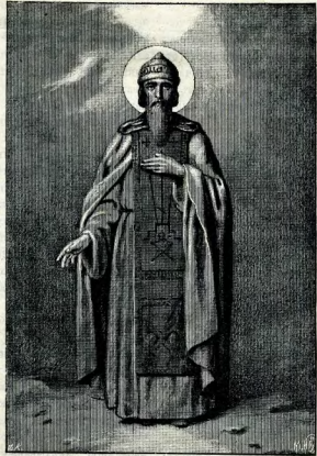
Даніилъ князь Московскій.

Двухлѣтнимъ младенцемъ остался Даніилъ по смерти достославнаго родителя въ такую эпоху, когда родственные князья русскіе усиленно, съ поправленіемъ старинныхъ родовыхъ правъ, всѣчески старались каждый увеличить